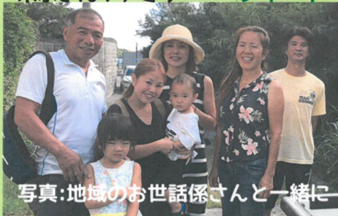
写真:地域のお世話係さんと一緒に